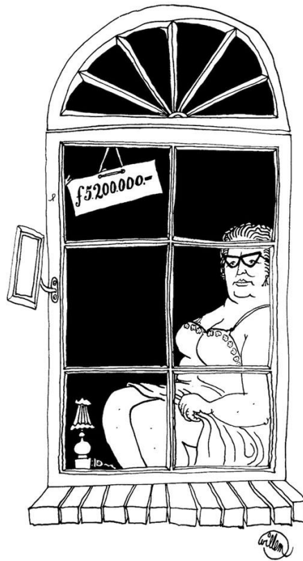
Cartoon 2: Ruben L. Oppenheimer (via zijn Twitteraccount: 19 december 2017)