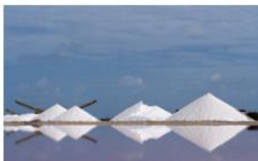
Op de eilanden wordt veel zout uit het water gehaald. Bijvoorbeeld voor op je eten.