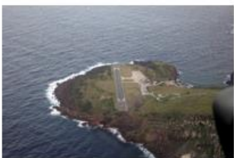
De landingsbaan op het vliegveld van Saba is de kortste van de wereld.