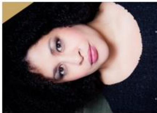
Dit is Tania Kross, een zangeres van opera. Zij is geboren op Curaçao.