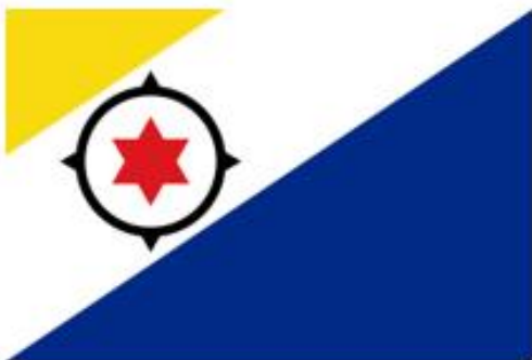
Dit is de vlag van Bonaire.