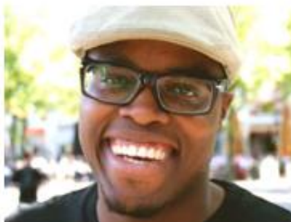
Dit is Jandino Aspraa, een bekende comedian en presentator. Hij is geboren op Curaçao.