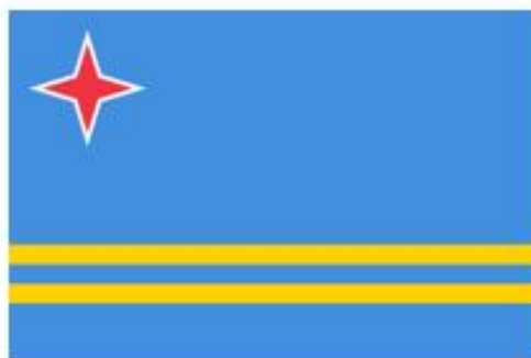
Dit is de vlag van Aruba.