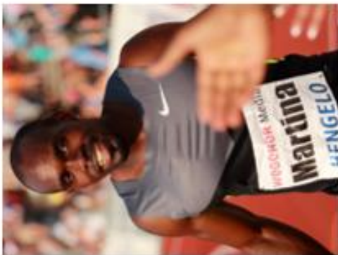
Dit is Churandy Martina, een sprinter. Hij is geboren op Curaçao.