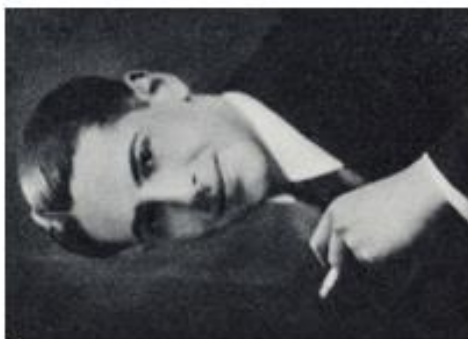
George Maduro vocht tegen de nazi's in de oorlog. Hij is geboren op Curaçao. Madurodam is naar hem vernoemd.