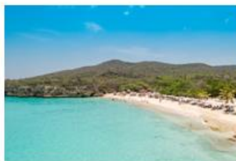
Er komen veel toeristen naar de eilanden. Bijvoorbeeld voor de mooie stranden.