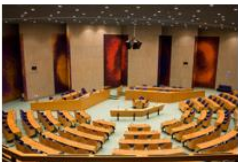
Op Bonaire, Sint Eustatius en Saba mogen de inwoners ook gewoon stemmen voor de Tweede Kamer.