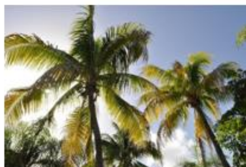
Op de eilanden schijnt de zon veel. Het is er vaak erg warm.