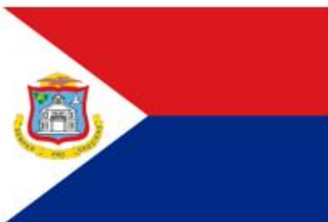
Dit is de vlag van Sint-Maarten.