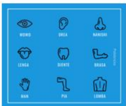
Op Aruba, Bonaire en Curaçao spreken ze Nederlands, maar ook Papiaments.