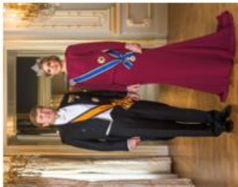
Willem-Alexander is ook koning van Aruba, Curaçao en Sint Maarten.