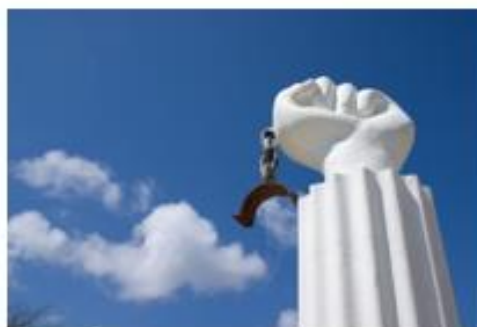
Vroeger haalde Nederland mensen uit Afrika om op de eilanden als slaaf te werken.