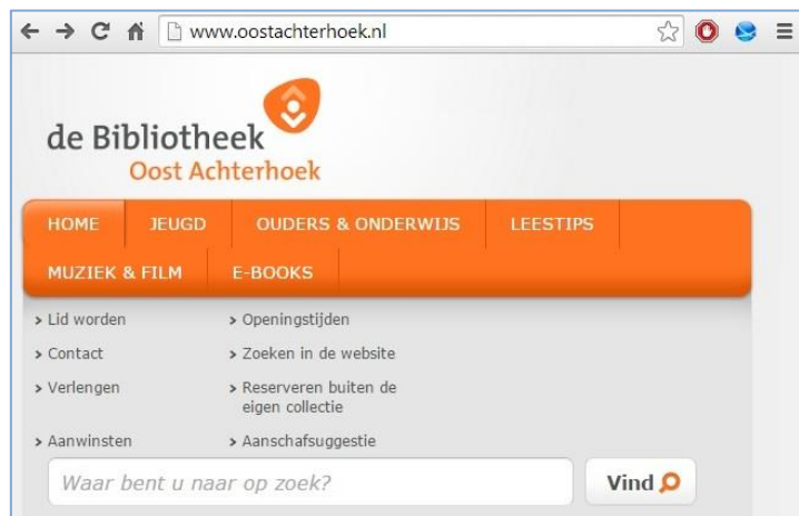
■ Een voorbeeld van een zoekmachine van een lokale bibliotheek.

Deze kunt u vaak via internet, vanuit huis, raadplegen. 14