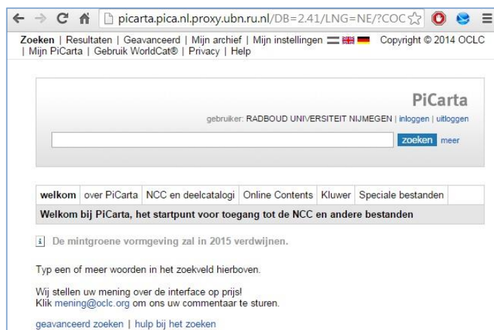
■ Een voorbeeld van een catalogussysteem van een wetenschappelijke bibliotheek.

Dit is een gemeenschappelijke online catalogus waarop meer dan vijftigduizend bibliotheken uit meer dan negentig landen zijn aangesloten. Hier kunt u zien in welke bibliotheken een bepaald boek te vinden is.