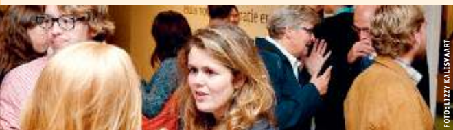
Kijk voor een actuele versie van de agenda op www.prodemos.nl/agenda

Meer informatie: www.prodemos.nl/lentetour