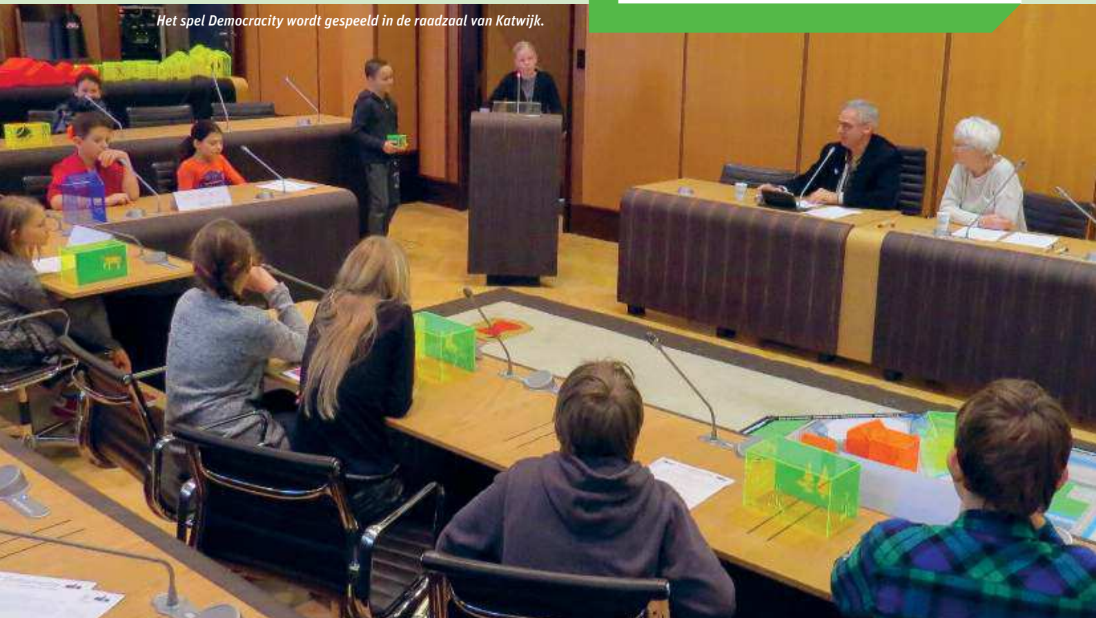
Het spel Democracy wordt gespeeld in de raadzaal van Katwijk.