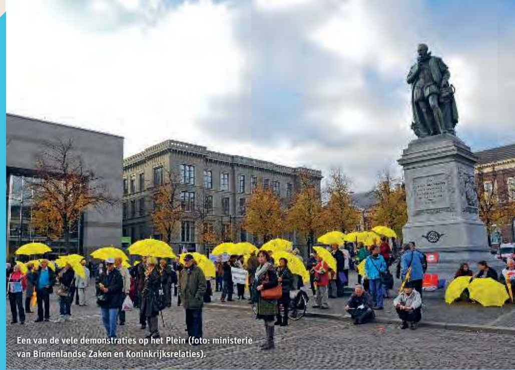
Een van de vele demonstraties op het Plein.

In 1633 werd op initiatief van stadhouder Frederik Hendrik een plein aangelegd, aanvankelijk Stadhoudersplein genoemd, nu gewoon Plein, op de plek waar de graven van Holland ooit moes- en siertuinen bezaten. Het Plein herbergt een aantal markante gebouwen, zoals twee voormalige logementen uit de tijd van de republiek: dat van Amsterdam (tegenwoordig behorend tot de burelen van de Tweede Kamer) en dat van Rotterdam (momenteel ministerie van Defensie). Aan het Plein staan verder de voormalige ministeries van Justitie en van Koloniën (beide nu kantoorruimte van fracties van de Tweede Kamer). Tussen deze twee gebouwen bevindt zich, op de plek waar ooit het gebouw van de Hoge Raad stond, de hoofdingang van de Tweede Kamer. Het Plein is 's zomers een soort 'Nieuwspoord in de open lucht': een ontmoetingsplek waar politici, ambtenaren, voorlichters en journalisten elkaar aan een tafeltje op één van de talrijke terrassen treffen.