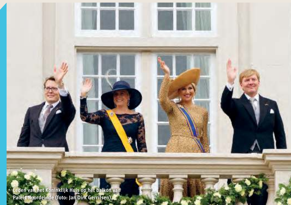
Leden van het Koninklijk Huis op het balkon van Paleis Noordeinde.

Achter de (politieke) schermen doen vele bedrijven en belangenorganisaties hun best om invloed te hebben. Dit kan op ministeries of op Europees niveau worden gedaan, maar lobbywerk speelt zich ook af op en rond het Binnenhof. Aan het Plein zijn verschillende lobbykantoren gevestigd, zoals de Koning Willem Kringen. Ook hebben in dit pand milieu- en natuurorganisaties hun krachten gebundeld. Ten slotte werken gemeenten en provincies hier samen om hun belangen veilig te stellen. In Sociëteit De Witte, eveneens gelegen aan het Plein, wordt menig politiek besluit voorgerekocht. Lobbyisten zijn niet weg te denken uit de Tweede Kamergebouwen. Een lobbyist woont debatten bij of laat opiniestukken schrijven door sympathiserende wetenschappers. Soms lukt het hem om een Kamerlid een pakkende oneliner toe te spelen. Even overleggen op één van de vele terrassen op het Plein hoort daar zeker bij!