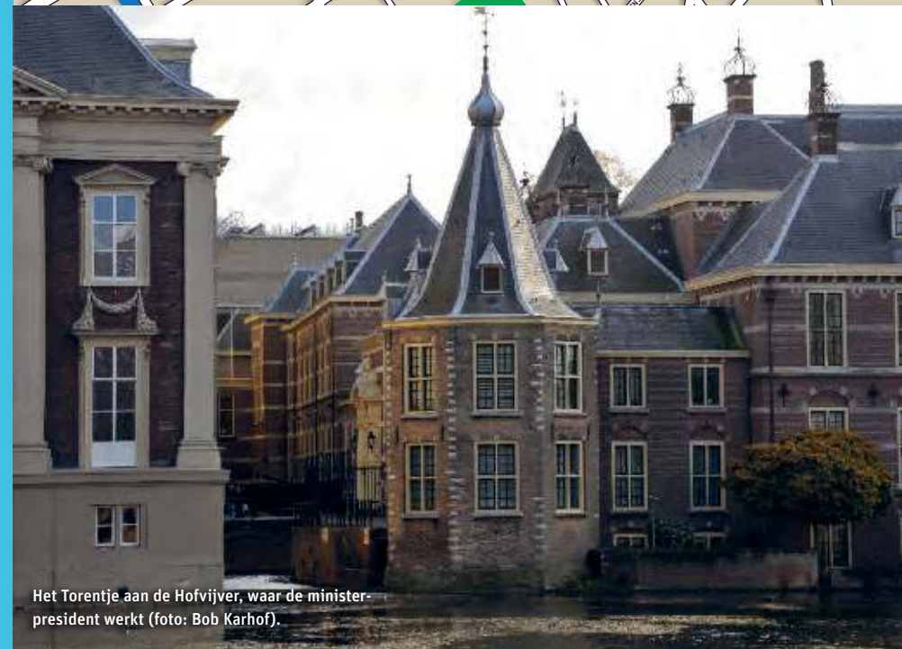
Het Torentje aan de Hofvijver, waar de minister-president werkt.