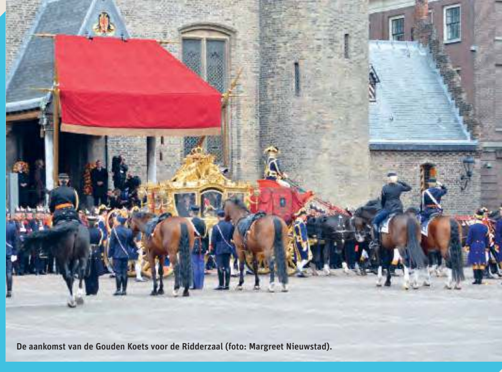
De aankomst van de Gouden Koets voor de Ridderzaal.

ProDemos – Huis voor democratie en rechtsstaat informeert burgers over de democratische rechtsstaat en stimuleert hen om hierin een actieve rol te spelen. Om zoveel mogelijk mensen bij de politiek te betrekken, werkt ProDemos op gemeentelijk, provinciaal en landelijk niveau. Zo ondersteunt ProDemos lokale initiatieven om burgers en openbaar bestuur met elkaar te verbinden. Daarnaast behoren rechtbanken en onderwijsinstellingen tot de samenwerkingspartners van ProDemos. In Den Haag biedt ProDemos een omvangrijk programma op en rond het Binnenhof aan. Jaarlijks worden hier tienduizenden scholieren, studenten, leden van politieke organisaties, toeristen en andere geïnteresseerden ontvangen. Met rondleidingen, debatten, lezingen, exposities, simulaties en cursussen leren zij meer over politiek, democratie en rechtsstaat.