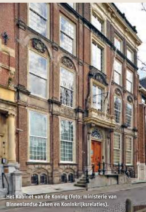
Het Kabinet van de Koning.

Nieuwspoord is een internationaal perscentrum. Politici, vertegenwoordigers van maatschappelijke organisaties, uitgeverij, iedereen die de wereld wat te melden heeft kan in Nieuwspoord een zaaltje huren om een persconferentie te beleggen of een boekpresentatie te houden. Vaste prik op vrijdag: de persconferentie van de minister-president voor de schrijvende pers over de besluiten van de ministerraad, als eerste afspraak in het media-rondje van de premier. Vervolgens spoedt de premier zich naar de NOS-studio aan de Hofweg voor een televisiegesprek. Nieuwspoord is daarnaast een sociëteit waar politici, voorlichters, lobbyisten en journalisten elkaar kunnen ontmoeten onder het genot van een goed maal en een drankje. De leden worden Poorters genoemd. In Nieuwspoord heerst de Nieuwspoordcode: een stilzwijgende afspraak dat alles wat binnen Nieuwspoord wordt gezegd op basis van anonimiteit gaat.