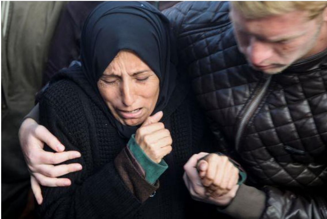
A mourner reacts near the bodies of Palestinians killed in Israeli air strikes in Khan Younis, southern Gaza, January 17, 2025.