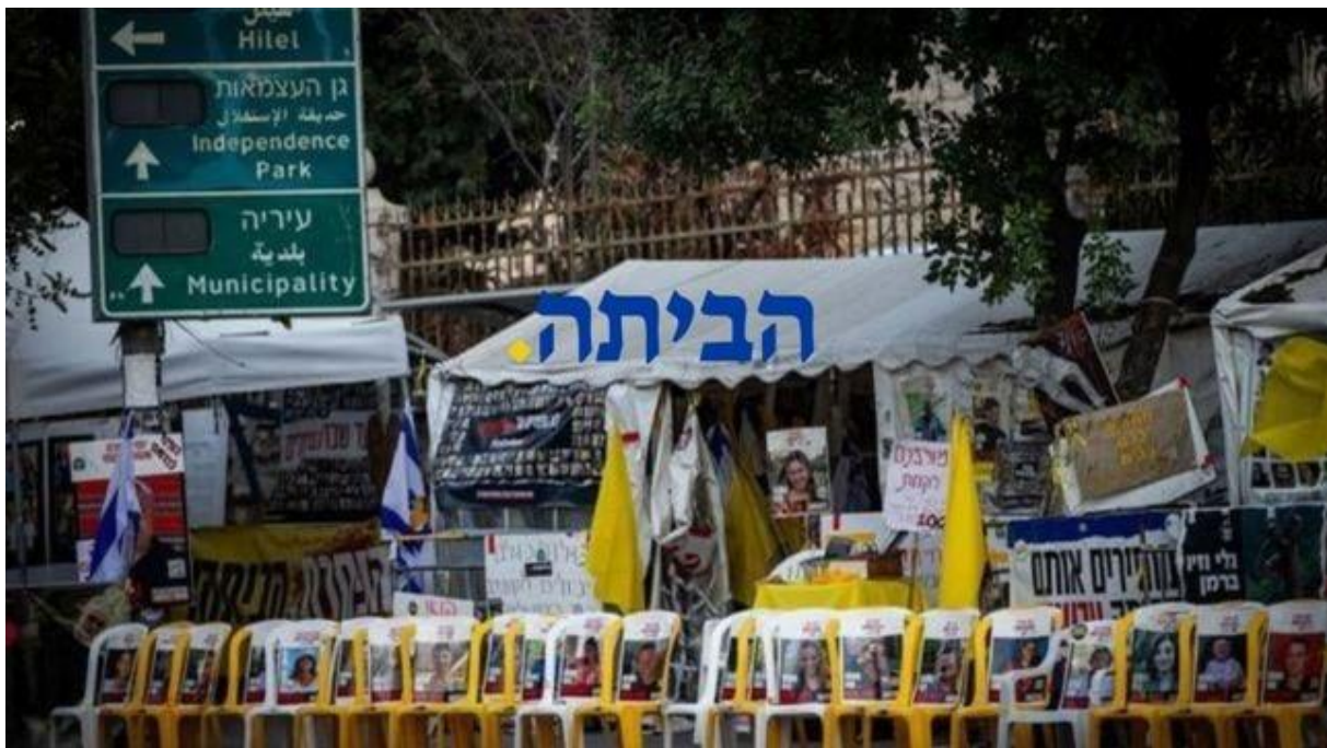
De Tent van de ontvoerden voor de residentie van de premier in Jerusalem_LogoHome

Rusland eist dat Hamas "prioriteit geeft" aan de vrijlating van de ontvoerde Alex Tropanov | Regelmatige updates