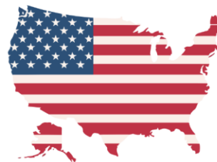
Verenigde Staten (VS)

Bij de verkiezingen spelen de staten een belangrijke rol. De staat gaat of naar de Republikeinen, of naar de Democraten. Vooral de 'swing states' zijn belangrijk, dat zijn de staten waarin er nog veel getwijfeld wordt.