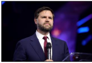
James David (J.D.) Vance

Hij is de 'running mate' van Donald Trump. Als Trump wint, dan wordt Vance vicepresident.