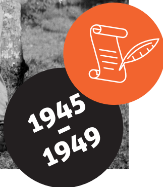
Een arrestant wordt afgevoerd