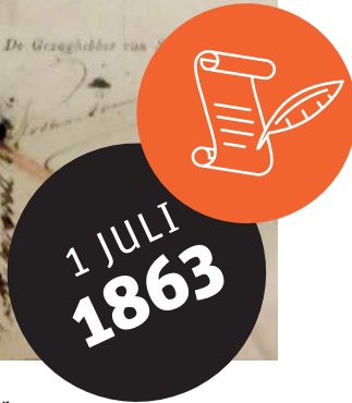
Een cheque voor 3200 gulden compensatie voor de plantage-eigenaar