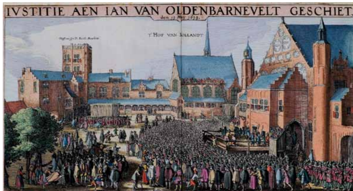
De terechtstelling van Johan van Oldenbarnevelt in 1619.

ProDemos is het 'Huis voor democratie en rechtsstaat'. ProDemos legt uit wat de spelregels zijn van de democratie en de rechtsstaat en laat zien wat je zelf kunt doen om invloed uit te oefenen. Dit schooljaar publiceren we in iedere Kleio een activerende werkvorm over de geschiedenis van de parlementaire democratie. De complete les inclusief de benodigde materialen, de link naar het filmpje en een uitgebreide docentenhandleiding vindt u op www.prodemos.nl/kleio . De Historische Blingo wordt ook gebruikt in het Republiekprogramma van ProDemos Binnenhof voor Scholen. Een gratis excursieprogramma voor havo en vwo.