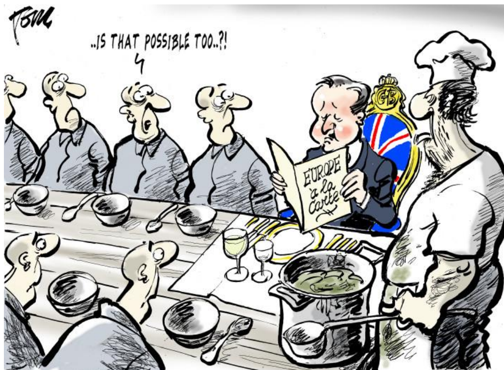
Door Tom Janssen (18 februari 2016)