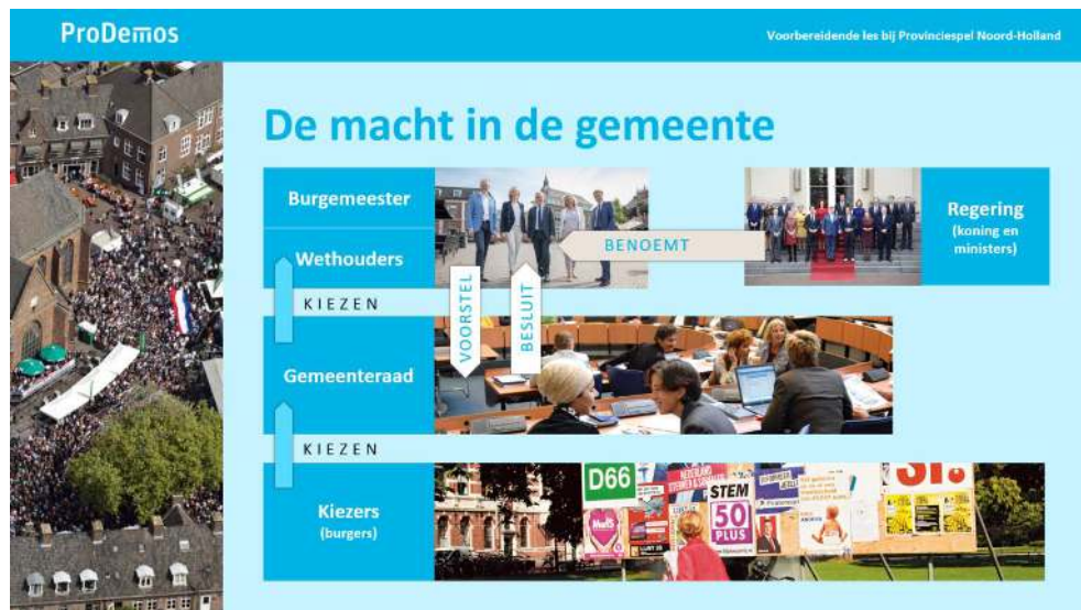
Dia 3, ingevuld