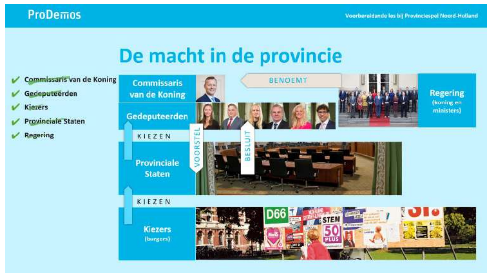
Dia 4, ingevuld