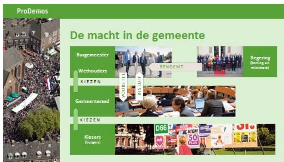
Dia 2, ingevuld