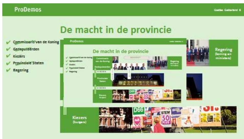
Dia 3, ingevuld