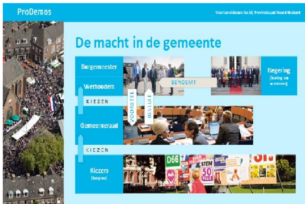
Dia 3, ingevuld