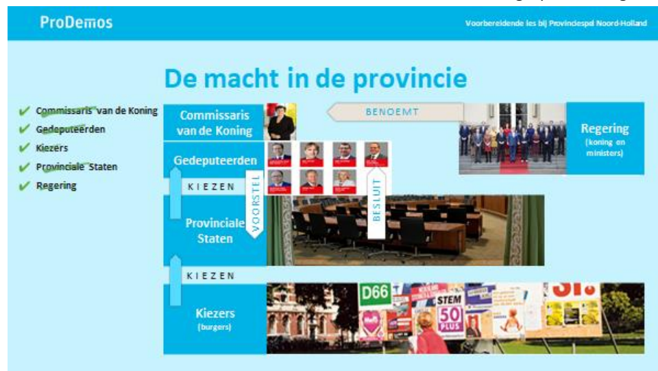
Dia 4, ingevuld