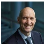
Ernst Kuipers (D66), Minister van Volksgezondheid, Welzijn en Sport

Als het nodig is kunnen er snel extra plekken bij komen op de Intensive Care in het ziekenhuis