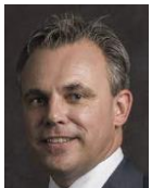
Mark Harbers (VVD), minister van Infrastructuur en Waterstaat