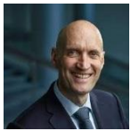
Ernst Kuipers (D66), Minister van Volksgezondheid, Welzijn en Sport