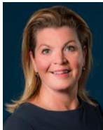
Christianne van der Wal (VVD), minister voor Natuur en Stikstof

Als het regeerakkoord er is, kunnen de regerende partijen ministers gaan zoeken voor in hun kabinet. De ministers voeren de afspraken uit die in het regeerakkoord staan. In deze werkvorm staat een deel van de plannen van de nieuwe regering. Welke plannen horen bij welke minister?