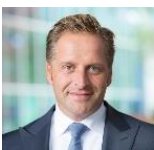
Hugo de Jonge (CDA), minister voor Volkshuisvesting en Ruimtelijke Ordening