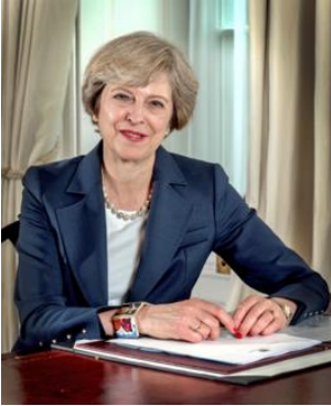
Theresa May (de minister-president van het Verenigd Koninkrijk)

6. Welke foto hoort niet bij het Verenigd Koninkrijk?