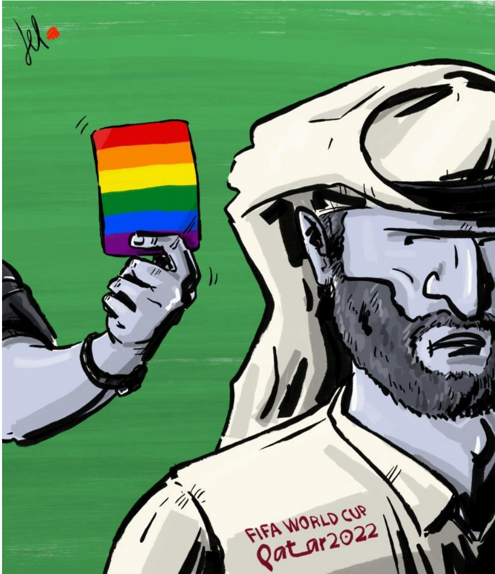
Rainbow card for Qatar