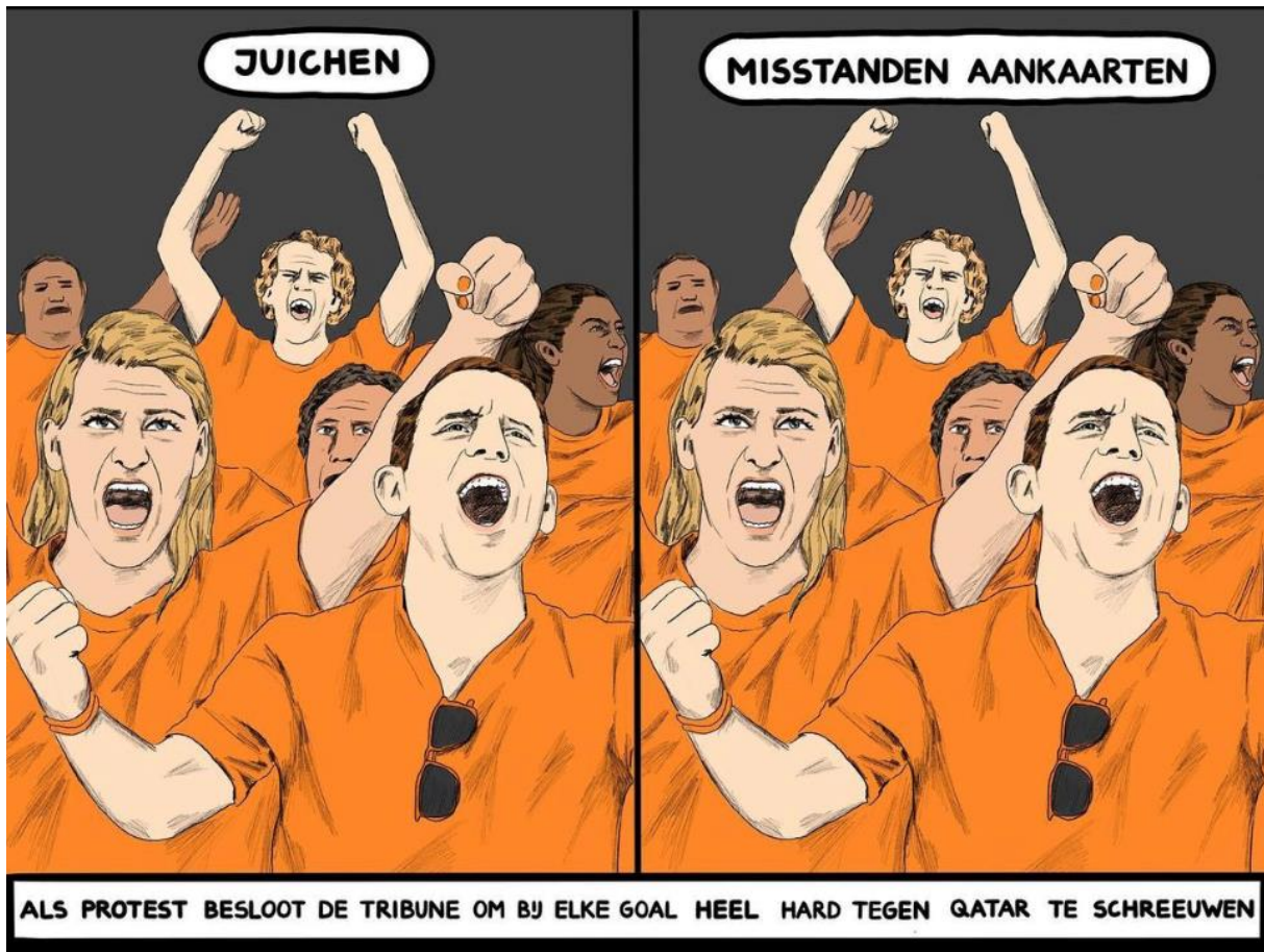
Jip van den Toorn - Deze cartoon verscheen in de Volkskrant.

5. Bekijk cartoon 2 en beschrijf letterlijk wat je ziet.