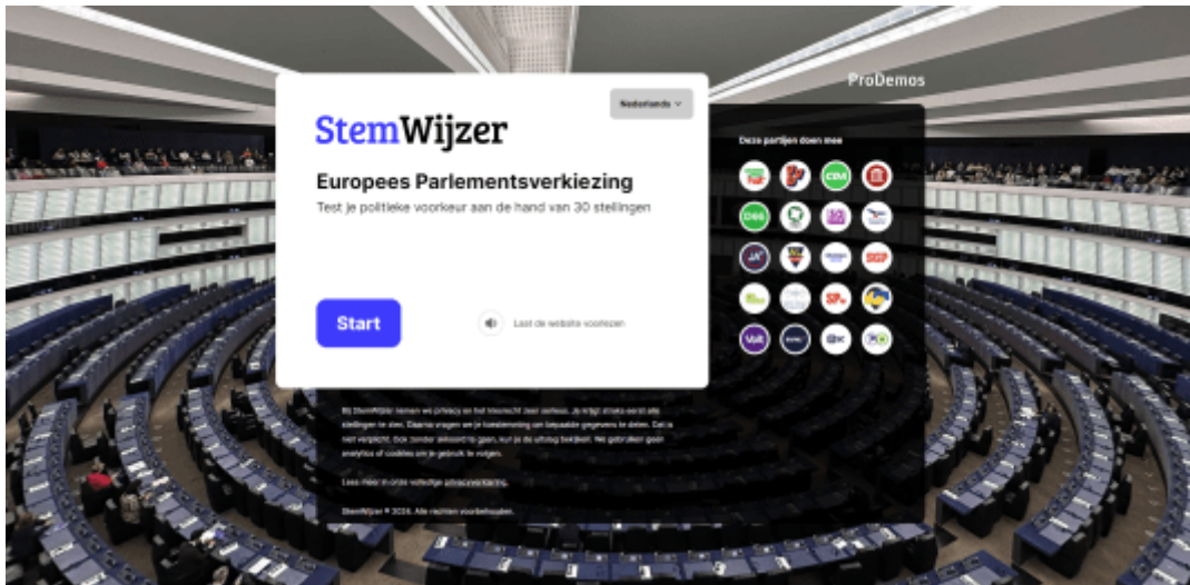
StemWijzer Europees Parlementsverkiezing 2024

Young Voice, dé stemhulp voor jongeren, werd bijna 25.000 keer ingevuld. Bij de laatste Europees Parlementsverkiezing in 2019 gebruikten bijna 15.000 mensen dit online hulpmiddel van ProDemos. YoungVoice-gebruikers kozen allereerst de thema's die zij belangrijk vinden. Voor de Europees Parlementsverkiezing was er keuze uit: klimaat en milieu, werk en geld, migratie, EU en de wereld, misdaad en recht, cultuur en technologie. Na het kiezen van vier of meer thema's krijgen gebruikers stellingen voorgelegd over deze thema's, uitgelegd in filmpjes door bekende influencers en presentatoren.