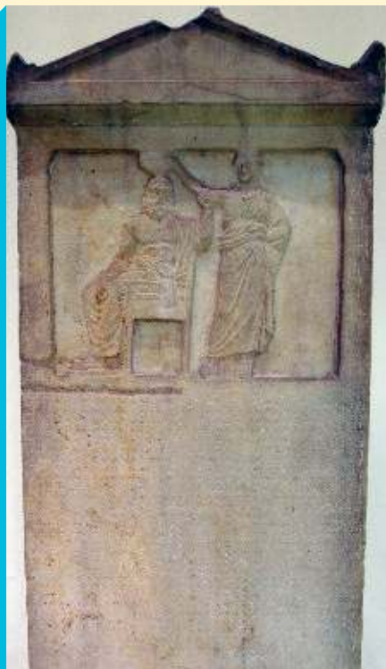
Stele van Democratie: wet tegen tirannie tot 336 voor Christus. Het reliëf aan de bovenkant van de stele is de personificatie van Demos bekroond door Democratie. Museum van de Oude Agora van Athene.

Om de continuïteit van deze functies te waarborgen, was herverkiezing mogelijk. Dat gold vooral voor militaire functies – en dan op de eerste plaats voor de tien legeraanvoerders, de strategoï . Uit elke fule werd er een gekozen. De tien hadden ook verantwoordingsplicht tegenover de volksvergadering. Vaak werd hun functie ingenomen door gezag-