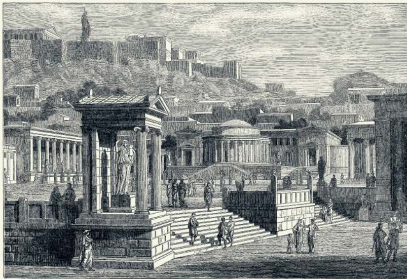
Alcagalla. Portico Proctus. View of Athens with the Acropolis. Basilicae. Temples of Athens. Aedificia. Temples of the Agora. AGORA OF ATHENS

Oude gravure van de Agora, het politieke centrum van Athene, waar de bestuursorganen gevestigd waren.