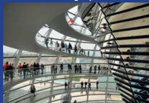
Koepel Rijksdag Berlijn