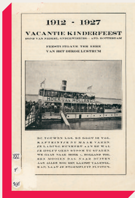
Feestuitgave Vacantie Kinderfeest uit 1927